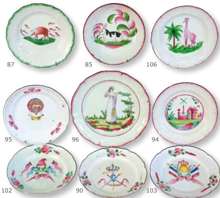
D'UNE COLLECTION DE FAIENCES des Islettes et de Lunéville, ép. XVIII's et XIX's

EXPOSITIONS PUBLIQUES Vendredi 29 juin de 10h à 12h et de 14h à 19h Samedi 30 juin de 10h à 11h30