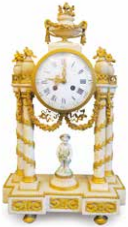
29. PENDULE portique de style Louis XVI en marbre et bronze doré, putto en porcelaine posé sur la terrasse, ép. XIX'. Haut. : 50 cm (accidents et manques) 800 / 1000 €