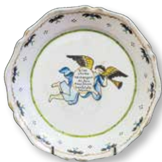
116. NEVERS. Rare assiette en faïence à décor d'une Renommée portant l'inscription «Si les choses ne changent de face nous serons bientôt à la besace», ép. révolutionnaire. Diam : 23 cm. 500 / 600 €