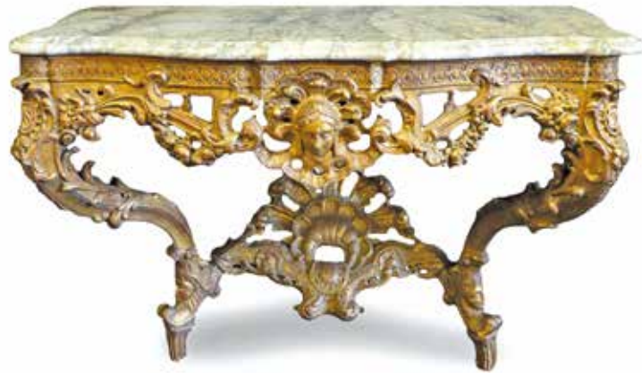
527. CONSOLE de style Régence en bois doré, sculpté et ajouré à décor de mascarons empanachés, guirlandes, rinceaux, coquille, etc..., posant sur deux pieds cambrés à entretoise, plateau marbre. Long : 1,35 m - Prof : 0,66 m - Haut : 0,83 m 2000 / 2200 €