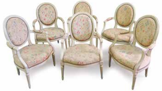
467. SUITE DE SIX FAUTEUILS d'ép. Louis XVI en bois peint, à dossier cabriolet médaillon, garniture en tapisserie. 1000 / 1200 €