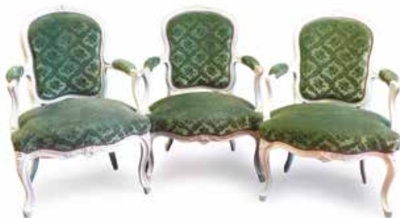
461. SUITE DE TROIS FAUTEUILS cabriolets d'époque Louis XV, pouvant faire suite, en bois repeint et sculpté de fleurettes, pieds cambrés (différences de hauteur) 500 / 600 €