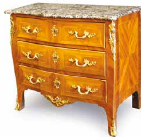
458. PETITE COMMODE galbée d'époque Louis XV en bois de placage marqueté, ouvrant par trois tiroirs, plateau marbre gris veiné. Larg : 0,95 m - Prof : 0,51 m - Haut : 0,80 m (restaurations) 2500 / 2800 €