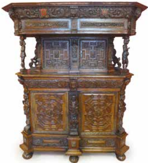
508. BEAU BUFFET-DRESSOIR flamand à deux corps en retrait à pans coupés, en chêne richement sculpté et mouluré, à décor d'enfants à mi-corps, bustes de personnages en cariatides, caissons géométriques, frise d'enfants et rinceaux encadrant des écussons, chevaux à mi-corps, animaux fantastiques et rinceaux, ép. XIX's. Haut : 2,15 m - Larg : 1,63 m - Prof : 0,64 m 3500 / 4000 €