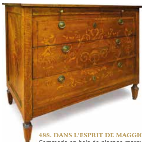
488. DANS L'ESPRIT DE MAGGIOLINI Commode en bois de placage marqueté de griffons, vases fleuris, rinceaux, frises d'oves, etc., ouvrant par quatre tiroirs sans traverse, travail de la région de Milan, ép. début XIX's. Long : 1,40 m - Prof : 0,66 m - Haut : 1,08 m (quelques manques, verni décoloré sur un côté) 1500 / 1800 €