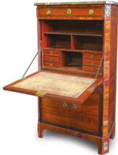
478. SECRÉTAIRE d'époque Louis XVI en bois de placage marqueté dans des filets à grecques, estampillé J.G.T. SAR (Jean-Girard-Théodore SAR, reçu maître en 1766) Haut. : 1,40 m - Larg. : 0,81 m - Prof. : 0,37 m 600 / 700 €