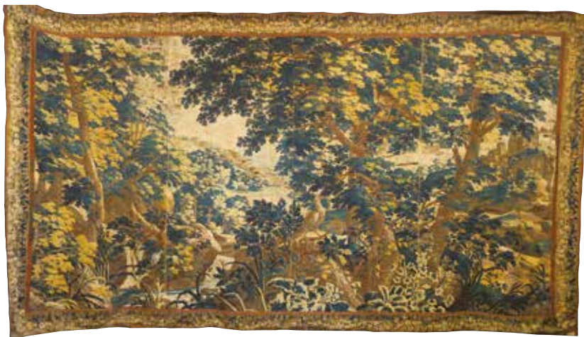
209. TAPISSERIE d'Aubusson d'époque XVIII' à décor d'une verdure avec couple de volatiles près d'une cascade, bordure à décor de fruits et de fleurs. Long. : 5,00 m - Haut. : 2,74 m (usures, réparations) 1500 / 2000 €