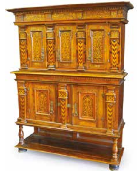
510. BUFFET-DRESSOIR Suisse à deux corps en retrait en bois naturel sculpté de frise de rinceaux en bas-relief et marqueté de rinceaux et oiseaux opposés, montants à pilastre, pose sur un socle à montants tournés, ép. XIX's. Haut : 2,05 m - Larg : 1,54 m - Prof : 0,55 m (quelques manques et restaurations) 1500 / 1800 €