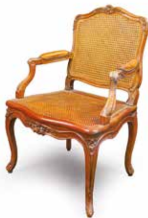
459. FAUTEUIL canné à dossier plat d'époque Louis XV en bois naturel sculpté de grenades, fleurettes et acanthes, estampillé I. GOURDIN ( Jean-Baptiste GOURDIN, reçu maître en 1748 ) (un pied antérieur réparé) 300 / 400 €