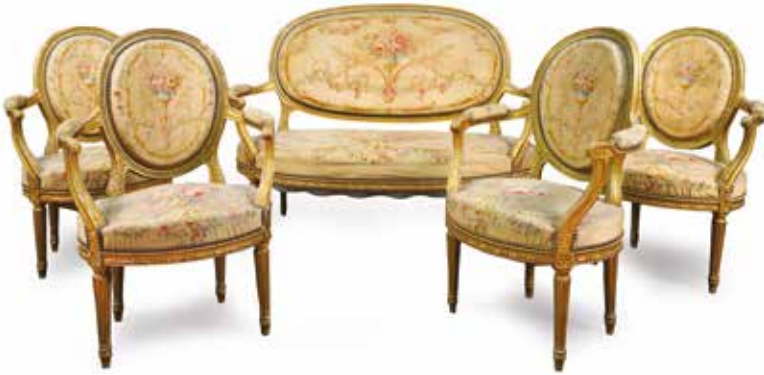
520. SALON Napoléon III de style Louis XVI en bois doré et sculpté, garniture en tapisserie d'Aubusson à décor floral «à la Saielemier», comprenant quatre fauteuils et une banquette (Long : 1,40 m) (à dépeussier, sautes de dorure) 1000 / 1500 €