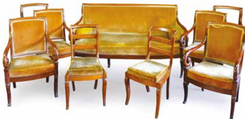
497. MOBILIER DE SALON à châssis d'époque Restauration en acajou et placage d'acajou, supports d'accotoirs à crosse, pieds cambrés à renflement, comprenant six fauteuils, une paire de chaises à barettes et un canapé. Long : 1,79 m (deux dossiers à regarnir) 600 / 700 €