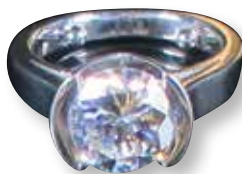
398. BAGUE or gris 18 K ornée d'un diamant rond de taille brillants demi serti clos pesant 3,48 cts, couleur F, pureté VS2, fluorescence : moyenne. Poids : 9,8 g (accompagné d'un certificat du Laboratoire Français de Gemmologie n°324 539 du 29 mai 2017). Expert : Cabinet E. et St. PORTIER Tél 01.47.70.89.82 28000 / 30000 €